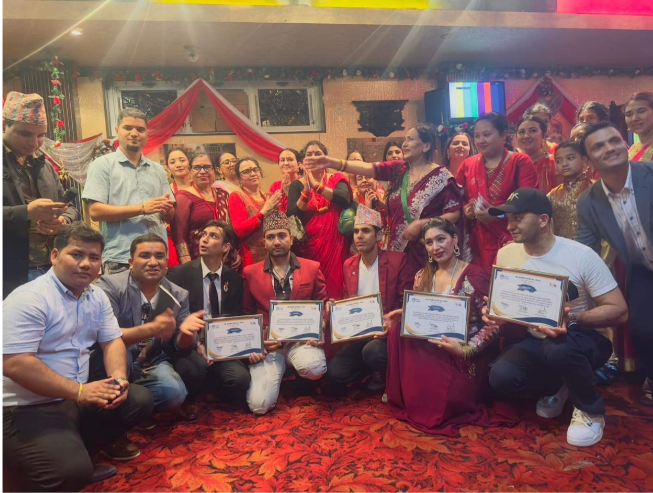
तिज विशेष साँस्कृतिक तथा दर कार्यक्रम २०२३