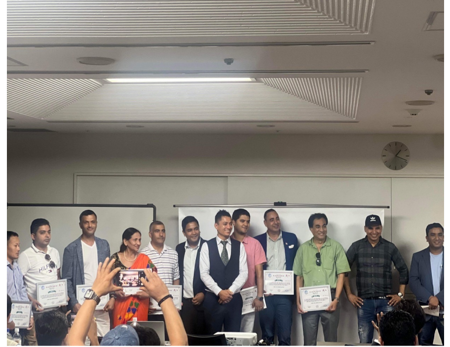
चिवा क्षेत्रिय समितिका सल्लाहकार ज्युहरुलाई प्रमाण-पत्र वितरण पश्चात लिएको तस्बिर ।