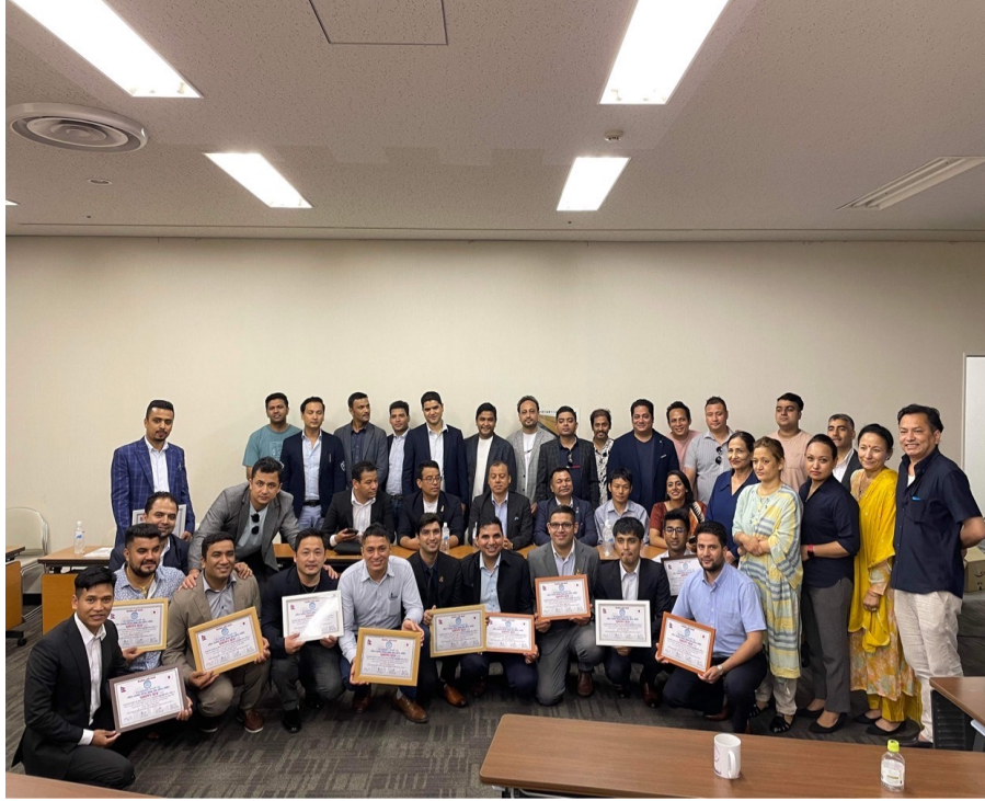
नव निर्बाचित समितिका पदाधिकारीहरु सपथग्रहण पश्चातको तस्बिर ।