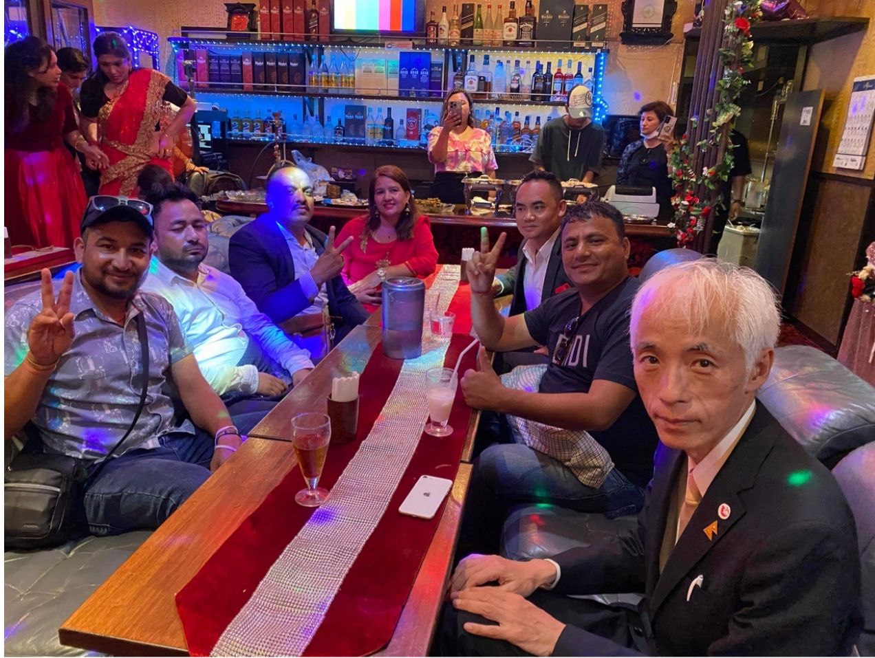
नेपाल राष्ट्रिय बेशबल समितिका पदाधिकारी ज्युहरु